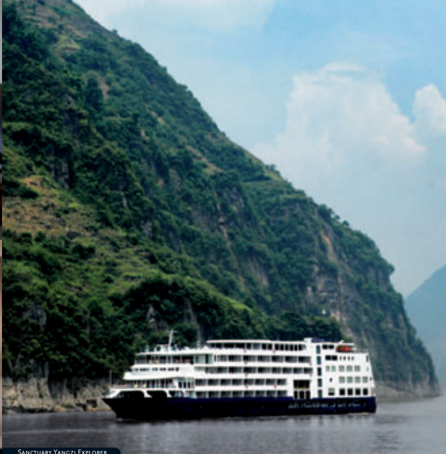
SANCTUARY YANGZI EXPLORER

de esta zona. Cadenas de verdes montañas, picos de formas diversas y grutas fantásticas. Almuerzo a bordo. Por la tarde paseo por el mercadillo del Poblado Yangshuo. Excursión a la gruta de estalagmitas y estalagmitas de "Plata". Regreso a Guilin. Alojamiento.