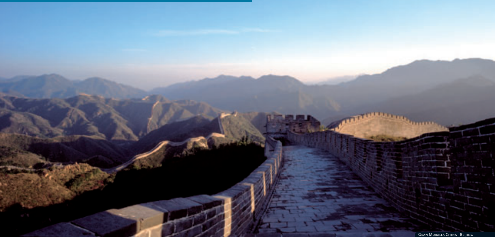
GRAN MURALLA CHINA - BEIJING