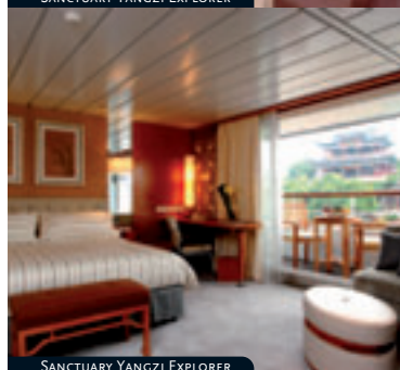
SANCTUARY YANGZI EXPLORER