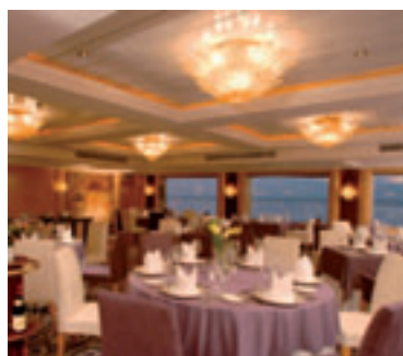
SANCTUARY YANGZI EXPLORER

Oferta sujeta a condiciones especiales de cancelación en caso de desistimiento por parte del consumidor.