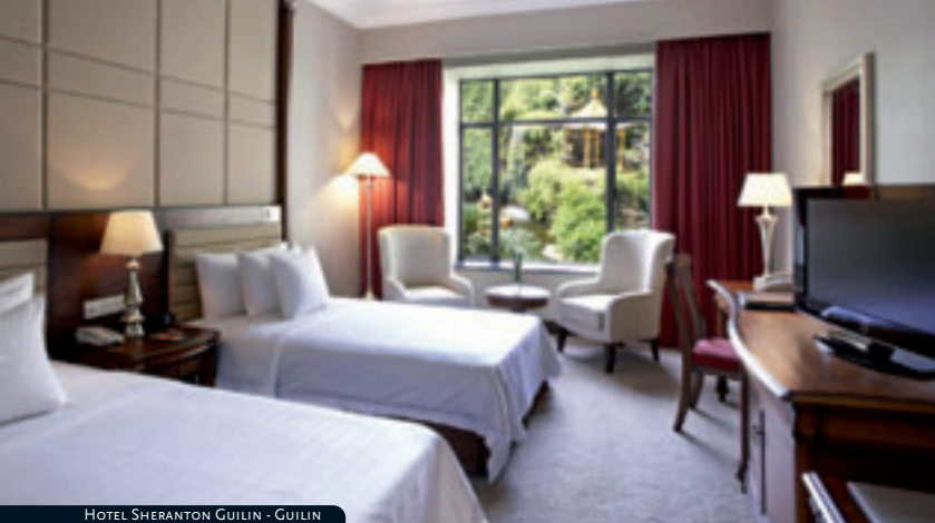
HOTEL SHERANTON GUILIN - GUILIN